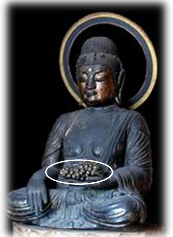
ぶどうを持った薬師如来像 ↑

日本には奈良時代にシルクロードを経て唐から渡来したとされており、高僧・行基が甲斐国勝沼(山梨県甲州市(旧・勝沼町))の柏尾山大善寺に薬種園を設け、そこでブドウ(甲州種)の栽培を始めたと言われています。