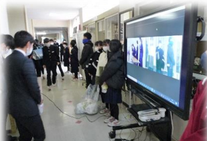
小国中生徒会とのライブ配信による交流

生徒会スローガン「Keep Up～いごこちを高め合える南中へ～」のもと企画会やボランティア委員会を中心にボランティア活動や募金活動を行いました。集まった募金は、12月27日（月）に赤十字の方が受け取りに来校する予定です。ご協力をいただきありがとうございました。