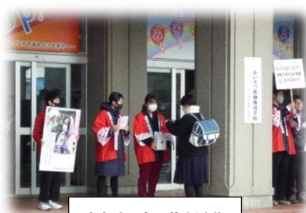
歳末助け合い募金活動

また、西置賜地区の各中学校生徒会と同時に行ったペットボトルキャップの回収の様子を、リモートで交流したことにより（写真左）、一体感が高まりました。