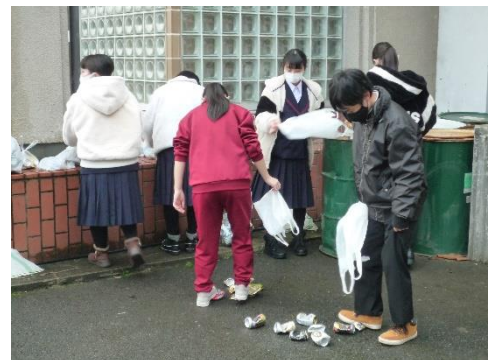
「ボランティアウィーク」空き缶回収の様子

運動会、創立40年記念式典、ラブリー長井、合唱コンクール。コロナ対策をしながら、「今できる」活動が多くの人に感動を与え、皆さんにとって達成感を得るとともに大きな自信になりました。行事を通して仲間や地域の方と関わる力や協調する力、やり遂げる強い意志など、以前話をした非認知能力が向上してきています。さらに、3年生の力を借りて、地区新人大会や吹奏楽部の大会でも確かな実績を残しました。(以下、省略)