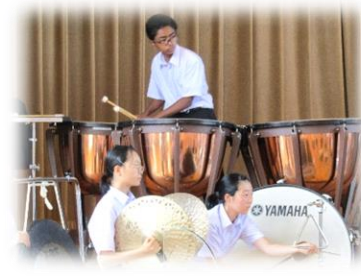
本校体育館での壮行演奏会