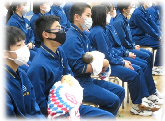
3年生 沐浴人形を抱きながら講話を聞きました