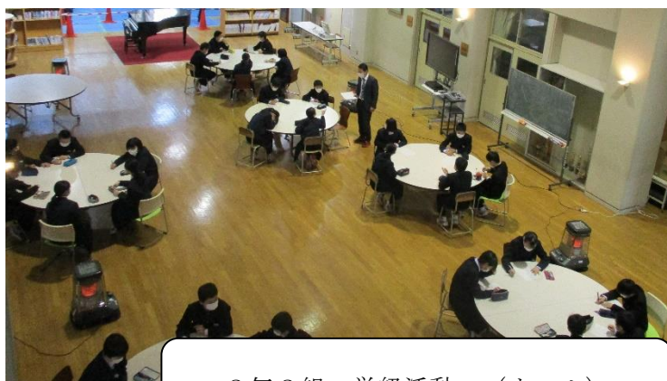
2年2組 学級活動 (ホール)

今回は、登校日に間に合いましたので、印刷をして配付できましたが、分散登校中も、(つれづれなるままに) 学年通信を発行し、ホームページにアップしております。休業中も時々ご確認くださいませようお願いします。