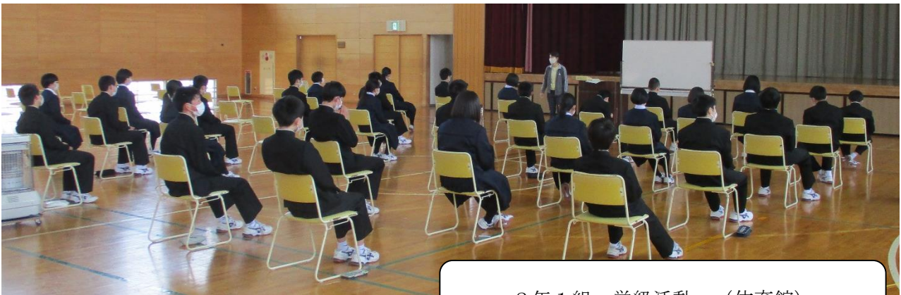
2年1組 学級活動 (体育館)