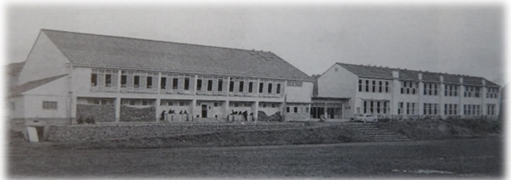
〈中津川中学校 旧校舎〉