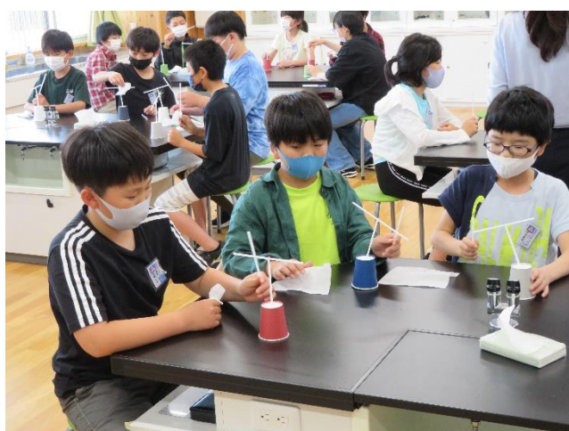
〈静気でストローが反発し合ってくるくる回ります〉