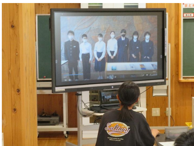
〈第一小出身の中学1年生からビデオメッセージ〉