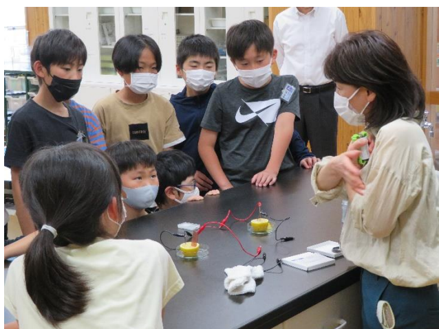
〈何とレモンでも電池がでちゃいます〉