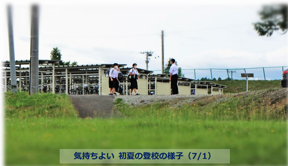
気持ちよい 初夏の登校の様子 (7/1)